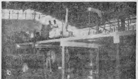
La gráfica en Pavas está en plena acción. Los molinos están trabajando, preparando pintura de acuerdo con las instrucciones recibidas. Se han mezclado ya las materias primas y ahora hay que darle el punto a la pintura.