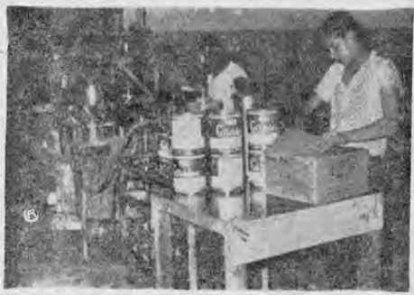
El envase es otra de las fases importantes del trabajo. Listo el producto se envasa en latas hechas en Costa Rica y se dispone en cajas de cartón, también hechas en el país. Los pedidos saldrán luego de la fábrica por medio de los camiones de distribución.

Lo importante es que ellos han contribuido decididamente a la corriente de industrialización del país, trabajando tesorosamente en que se produzcan buenas pinturas en Costa Rica para beneficio de los consumidores, de los trabajadores y de otras industrias, establecidas de las cuales tienen que servir, como ya se ha dicho, para atender la demanda actual. Todo movimiento industrial que tienda a crear riqueza como éste tiene que merecer la simpatía general de los costarricenses. LA REPUBLICA, deseando hacer hechos como este crece contribuyendo también al mejor conocimiento de los hechos y a ilustrar a sus lectores sobre lo que es y lo que hace la industria nacional.