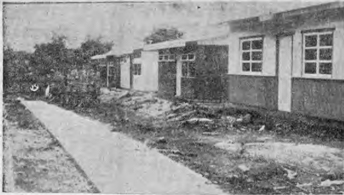
Muestra la presente fotografía una vista del programa de construcción de viviendas de la Finca La Mora, la cual fue construida por el Instituto Nacional de Vivienda y Urbanismo para la Cruzada Femenina Cristiana. Se trata de ochenta y cinco ca-

sas de dos dormitorios, construida en madera debidamente urbanizadas cuyo costo total (construcción y lote) ascendió a la suma de seis mil colones. Las casas serán entregadas el día 15 de noviembre próximo.