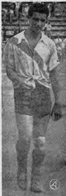
rigentes del Deportivo Costa Rica.

De toda forma hemos cumplido con nuestro deber al publicar la rectificación que de hecho nos solicitan los señores di-