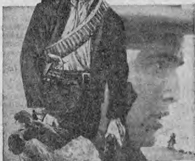
LA GIGALA EN UN KATY JURADO JOHNSON PINA PELLICER PRESENTA FURIA Y ODI DE UN HOMBRE TRAICIONADO EN UNA PELICULA TREMENDAMENTE EMOCIONANTE DURA, REALISTA ROMANTICA, TIERNA

ILA FURIA Y EL ODI DE UN HOMBRE TRAICIONADO!... EN UNA PELICULA TREMENDAMENTE EMOCIONANTE... DURA, REALISTA... ROMANTICA, TIERNA