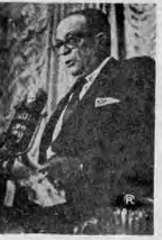
Dr. MIRO CARDONA ...un urgente cable enviado al mediador U Thant...

El mismo dice que la "retirada militar de los soviéticos de Cuba ha terminado victoriosamente una fase de la situación de allí. Pero la lucha debe de continuar hasta que sea lograda la total liberación de Cuba del comunismo."