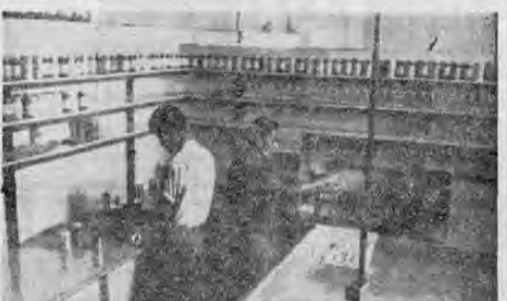
Esta es la primera etapa del trabajo. Aquí, en el laboratorio, se hacen las primeras pruebas de la pintura que va a prepararse. Hasta tanto las pruebas no sean satisfactorias no se procede a dar las órdenes para iniciar el trabajo en los molinos. Todo es cuidado y orden en esta industria de pintura. El producto para los clientes tiene que ser de excelente calidad.